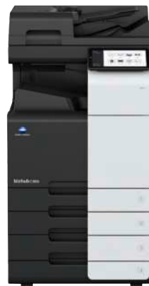
bizhub i-Serie C360i