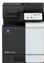
bizhub i-Serie C4050i

Wenn Ihr Unternehmen wächst, wachsen wir mit Ihnen. Wir verbinden Menschen und Orte nahtlos, um eine neue Dimension des Dokumenten-Workflows und Sicherheitsmanagements zu schaffen.