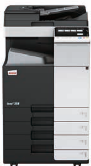
ineo+ 258 mit Dual Scan Originaleneinzug (DF-704), Ausgabefach (OT-506) und Papiereinzug (PC-210)

Wenn Sie in eine ineo+ 258 investieren, sind Sie in Bezug auf Spezialaufgaben, wie z. B. auf hochwertigem Karton gedruckte Einladungen, nicht mehr von externen Dienstleistern abhängig. Dadurch sparen Sie Zeit und Geld. Mit der ineo+ 258 können Umschläge, Recyclingpapier, vorbedrucktes Papier, OHP-Folien, viele andere Medien und selbst Karton bis zu einem Papiergewicht von 300 g/m 2 bearbeitet werden. Diese Systeme können zahlreiche Papierformate, von A6 bis A3+ (SRA3), sowie benutzerdefinierte Formate und Banner bis zu einer Länge von 1,2 Metern bedrucken. Außerdem ermöglichen die vielfältigen Endbearbeitungsoptionen das Erstellen bis zu 80-seitiger Broschüren, verschiedene Arten des Brieffaltens, das Heften von Handouts oder Lochen von Rechnungen. Mit einer ineo+ 258 kann fast jeder Druckauftrag intern bearbeitet werden.