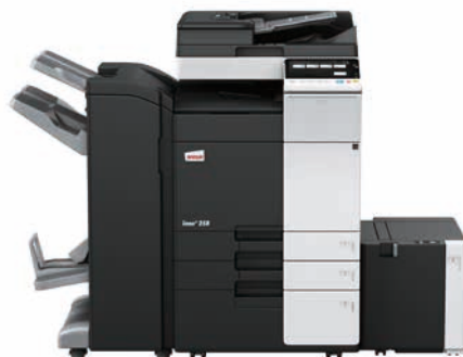
ineo+ 258 mit Dual Scan Originaleneinzug (DF-704), Heftfinisher mit Broschüreeneinheit (FS-534SD), Großraumpapiermagazin (LU-302) und Papiereinzug (PC-410)