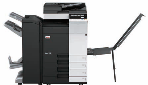
ineo+ 258 mit Dual Scan Originaleneinzug (DF-704), Heftfinisher mit Broschüreeneinheit (FS-534SD), Bannereinzug (BT-C1e) und Papiereinzug (PC-210)