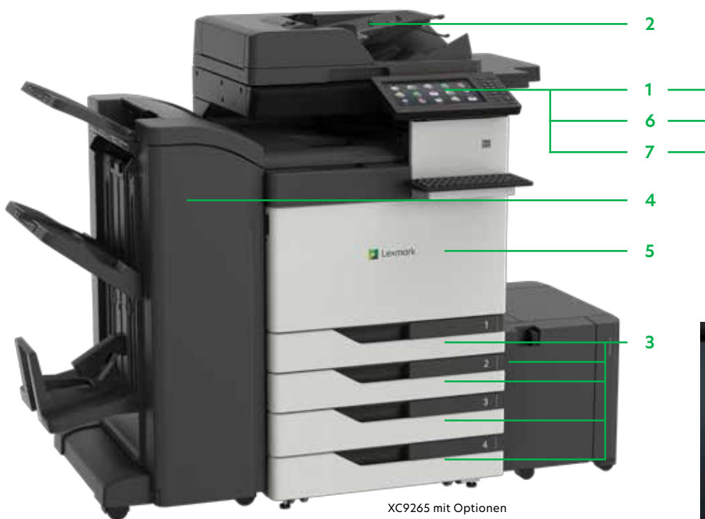
XC9265 mit Optionen

Drucken Sie Microsoft Office-Dateien, PDFs und andere Dokument- und Bildarten von Flash-Laufwerken, oder wählen Sie Dokumente auf Netzwerk-Servern oder Online-Laufwerken aus und drucken Sie sie.